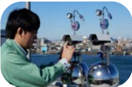
空気を集めている様子