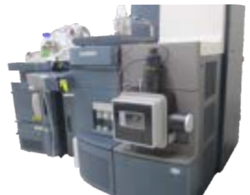
研究所にある分析装置