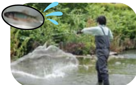
川の生き物をつかまえている様子