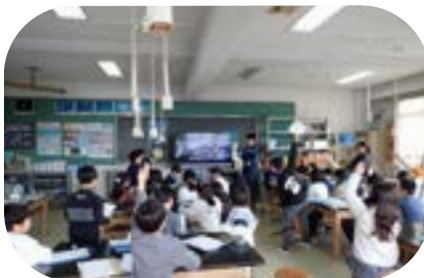
環境出前授業の様子