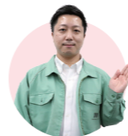
川崎市環境局 職員