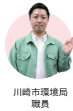
川崎市環境局 職員