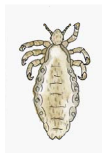
アタマジラミ 成虫