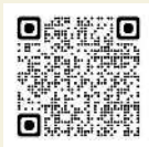
川崎市救急受診ガイド 二次元コード