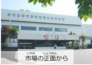
いちば しょうめん 市場の正面から

いちば た さかな やさい くだもの あつ 市場は、みなさんが食べている 魚 、 野菜 や 果物 が集まってくるところです。