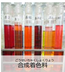
ごうせいちゃくしょくりよう 合成着色料

しら しょくひん いろ かお ほそんきかん なが 調べています ※食品に色や香りをつけたり、保存期間を長くしたり、やわらかくしたりする ためにつか つか かた りよう しょくひん つか き ために使います。使い方や量、どんな食品に使えるのかなど決まりがあります。