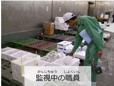
かんしちゆう しょくいん 監視中の職員