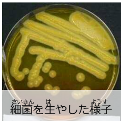
さいきん は ようす 細菌を生やした様子

いちば う しょくひん けんさ びせいぶつけんさ りかがくけんさ 市場で売られている食品を検査（微生物検査と理化学検査）しています