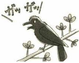
ガッガッと濁った声を出す