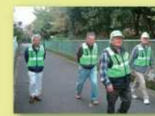
住民による防犯パトロール