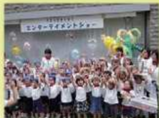
たまたま子育てまつりオープニング