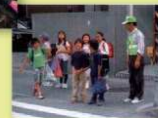
児童下校時の安全見守り活動