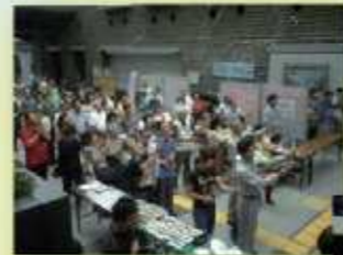
多摩ふれあいまつりオープニング