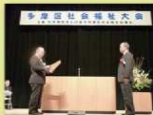
多摩区社会福祉大会での表彰の様子