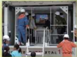
町内会による防災訓練