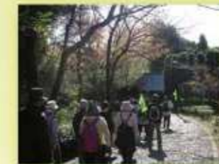
ウォーキング体験