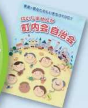
町内会自治会リーフレット