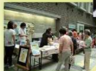
地域作業所の自主製品展示販売