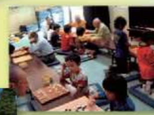
碁や将棋を通じた子どもと高齢者の交流