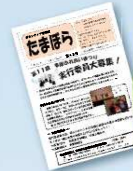
ボランティア情報誌「たまぼら」