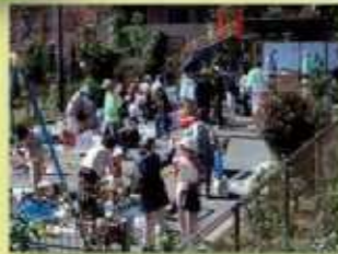
自治会によるフリーマーケット開催