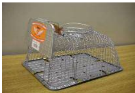
カゴ式ねずみ捕り