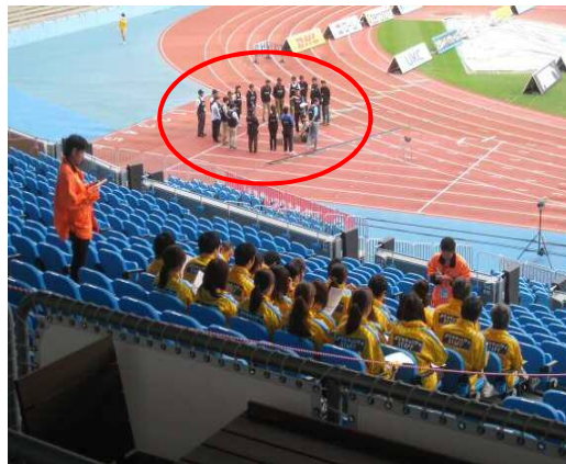
② ミーティングが終わると清掃の説明 運営スタッフもミーティングを行っています。