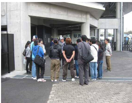
① まずは就労体験の参加者で簡単なミーティングを行います。

今回は、就労体験メンバー13名、事業所職員(支援者)5名 ピープルデザイン研究所2名、川崎市職員1名の合計21名で実施しました。