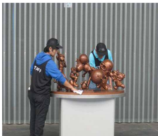
④ 毎回、銅像を拭いているのも私たちでした♪