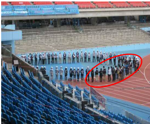
① ボランティアミーティングにも参加します♪ スタッフの心得について説明を受けます。