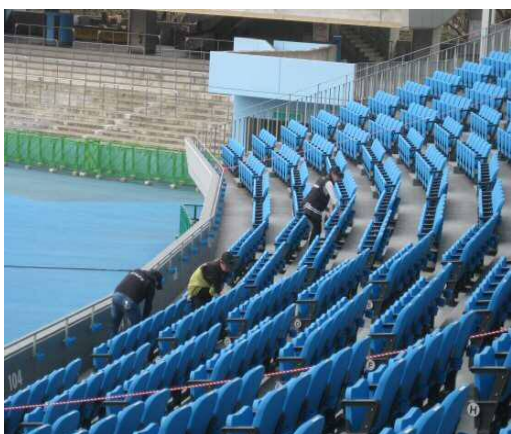
③ 作業は簡単♪前半は黙々とイスを拭きます!