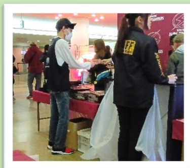
川崎ブレイブサンダース チラシ配布