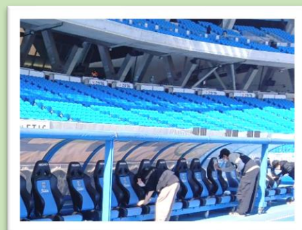
川崎フロンターレ 選手座席清掃