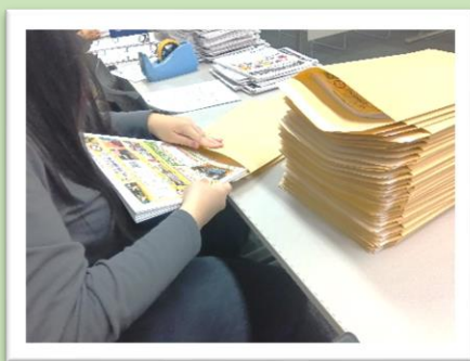
川崎市文化財団 チラシ封入