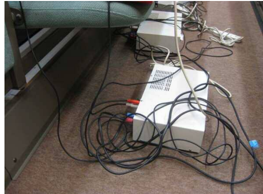
②コードを繋ぐのが少しややこしいけど 作業は簡単、コードをアンプに繋ぐだけ！