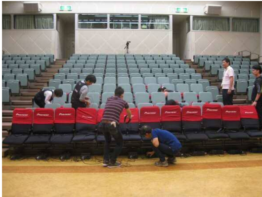
① 一部の座席に体感音響の機械をセットします♪ アンプやシート、コード等を各座席に運びます。