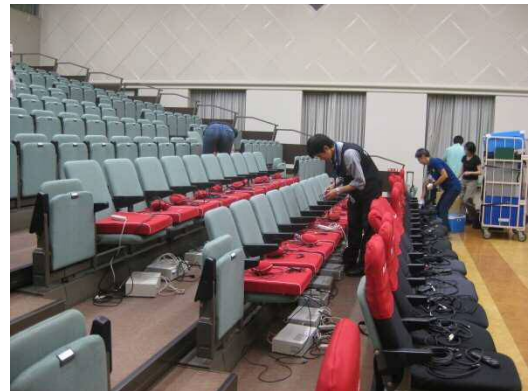
④今回は少し多めにセットしました♪ 最後はパイオニアスタッフが確認します！