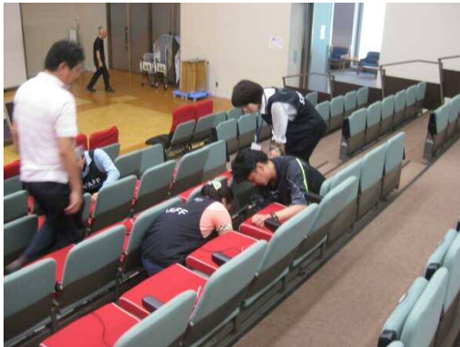
③ 分からないことは教えてくれるので安心♪ 「事業所の職員よりもやさしい」という声も（笑）