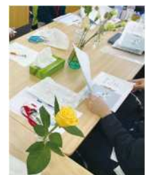
グループワーク「フラワーセラピー」の様子

当事業所は、2023年4月に宮前平駅から徒歩2分の場所にオープンした、宮前区で唯一の就労移行支援事業所です。利用者様の状況・状態に応じて、お一人お一人に合わせた個別プログラムを提供しています。そして、様々な資格獲得をバックアップさせて頂くことで、就職を強力にサポートしています。グループワークは、ビジネスに直結するものから、創作力、コミュニケーション力を培うものまで、様々ご用意しています。スタッフ全員、利用者様に寄り添った丁寧な支援を心がけており、初めての方でも安心してお越し頂ける明るい雰囲気の仕事所です。是非私達と一緒に、これからの未来を考えて、拓いていきましょう！