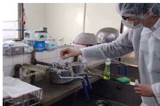
図4 給食施設での監視風景