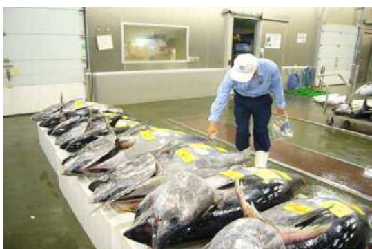
図3 卸売市場での監視風景

また、行政処分等を行った場合は、違反内容等を公表するとともに、関係自治体や国の機関と連携して対応します。