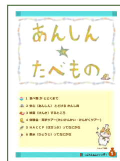
一日食品衛生監視員体験会の様子 ハムッポ店长による市Twitterページでの報告 子ども向け冊子