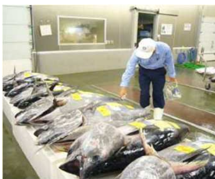
図4 卸売市場での監視