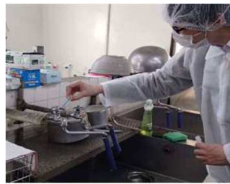
図5 給食施設での監視