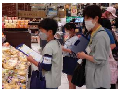
図8 一日食品衛生監視員体験会

また、特に近年流行している野生鳥獣肉（ジビエ）※、食中毒発生件数上位のアニサキス、高齢者や小児が発症すると重篤な症状を引き起こす腸管出血性大腸菌の食中毒が発生しないよう、正しい知識の普及に努めます。