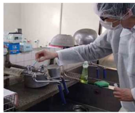
図7 給食施設での監視