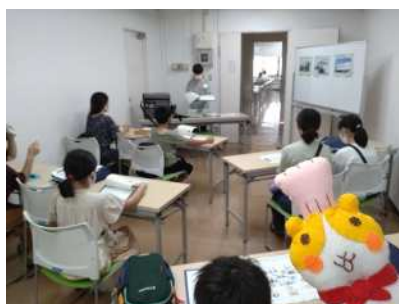
図9 ハムッポ店長の食品安全レポートの配信〔X（旧Twitter）〕