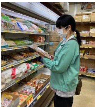
図5 小売店での監視

また、行政処分等を行った場合は、違反内容等を公表するとともに、関係自治体や国の機関と連携して対応します。