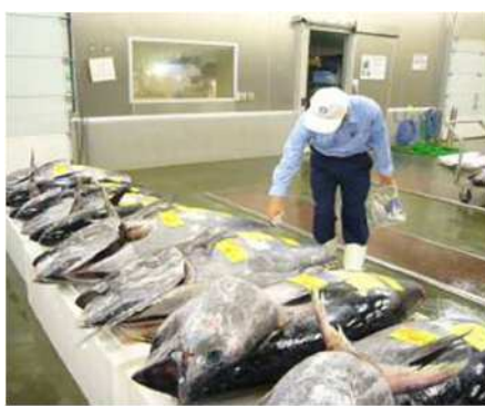
図6 卸売市場での監視