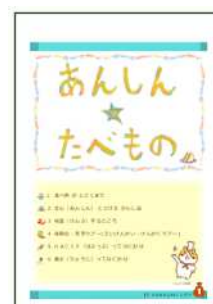
図10 子ども向け冊子