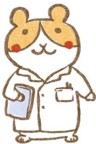
ハムップ店長 (川崎市食品安全推進キャラクター)