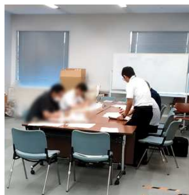
図12 事業者向け HACCP 衛生管理計画書等作成会