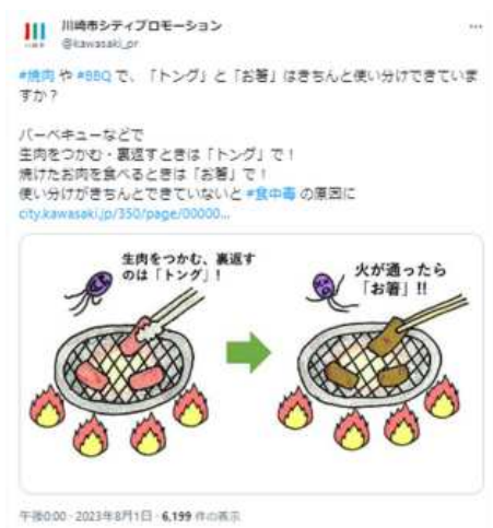
図11 X（旧Twitter）配信による啓発