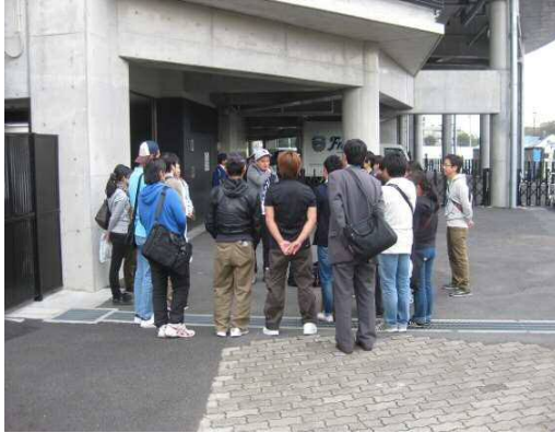
① まずは就労体験の参加者で簡単なミーティングを行います。

今回は、就労体験メンバー13名、事業所職員（支援者）5名 ピープルデザイン研究所2名、川崎市職員1名の合計21名で実施しました。