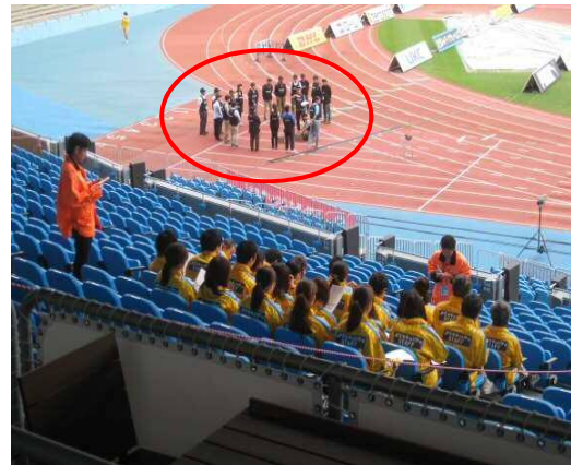
② ミーティングが終わると清掃の説明 運営スタッフもミーティングを行っています。