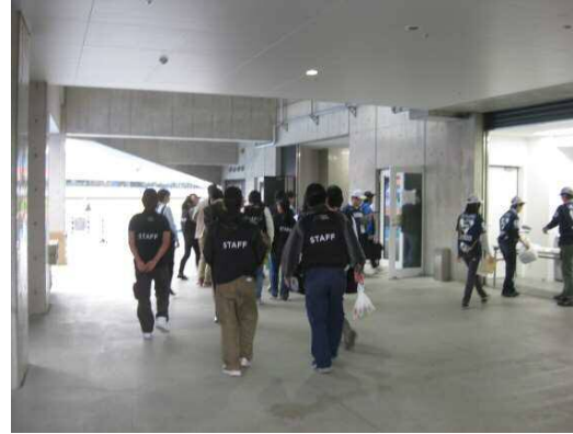
② 就労体験用のキャップとビブスを身につけて控室に移動します。