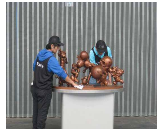
④ 毎回、銅像を拭いているのも私たちでした♪