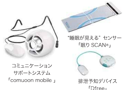
コミュニケーション サポートシステム 「comuoon mobile」 「睡眠が見える」センサー 「眠りSCAN®」 排尿先知デバイス 「Dfree」

排尿のタイミングを予測するウェアラブル機器や、睡眠の状態を計測する機器など多数の製品を展示。どのように高齢者や障害のある方の自立支援、介護者の負担軽減につなげていくか考えるきっかけになればと考えています。