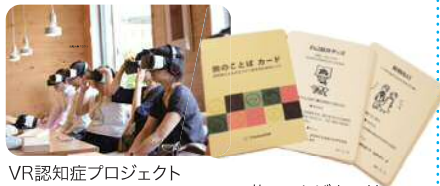
VR認知症プロジェクト 旅のこぼれカード (認知症とともによりよく生きるためのヒント・カード)

※ 13歳以上の方が対象のプログラムとなります。 ※ ご参加希望の方は、以下Webサイトの申込フォームからお申し込み下さい。