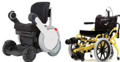
次世代型電動車椅子 パーソナルモビリティ 「WHILL Model A」 足こぎ車いす 「COGY (コギー)」

次世代型モビリティWHILLと足こぎ車いすCOGYが登場。KIS認証製品でもある両製品を体験することで、足腰が弱くなってきた人たちに、自分の力でどこかへ行きたい、自由が広がる気持ちを届けて欲しいと考えています。