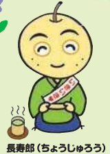
長寿郎 (ちようじゅうろう)

いきいきと元気に過ごすヒントが盛りだくさん。 楽しい経験が、社会参加のきっかけに。