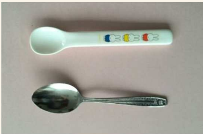
丸みのあるスプーン