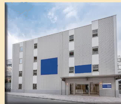
たてものがいけん 建物外観