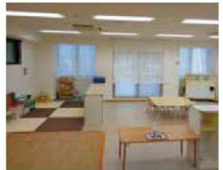
かもみーる かわさき