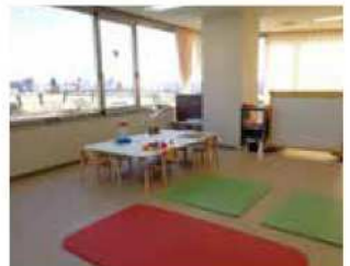
かもみーる さいわい