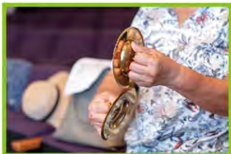
この小さな金属の打楽器チャップパが太鼓の音にアクセントをつけます。

仕事や家事を忘れてひたすら叩くこの時間が「心地よいです」。現在部員14名ほど。さらに募集中です。