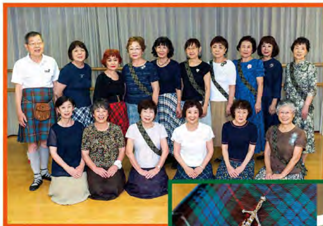
20年、30年と レッスンを重ねてきた メンバーも数多くいます。