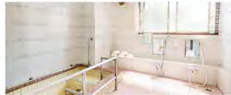
浴室での入浴を楽しみに訪れる方も。マッサージチェアもあります。