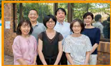
センターのメンバー。 後列中央が所長。