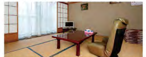
談話室では定期的にマッサージの施術も行います。