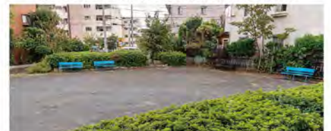
ホールの奥にはゲートボール場があります。