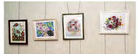
施設内の壁には、押し花作品が飾られています。

垣根のない交流が地域の活性化につながり、講座や同好会で訪れる人たちもますます活気に満ちています。