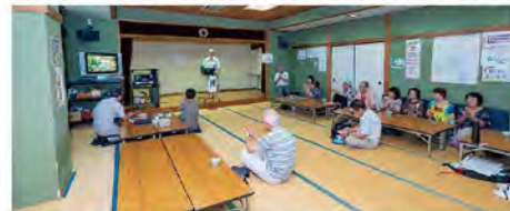
大広間では歌声を披露する人、和やかに聴く人が交流。