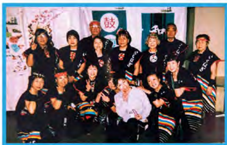
音楽会のときはコスチュームをそろえきりとした出で立ち。

すぐに演奏できるレパートリーは10曲以上。笛やチャップパなどの楽器もメンバーが担当し、音に深みを添えます。年に2回ほどの音楽会の出演を目指し、真剣に楽しく、練習を重ねています。