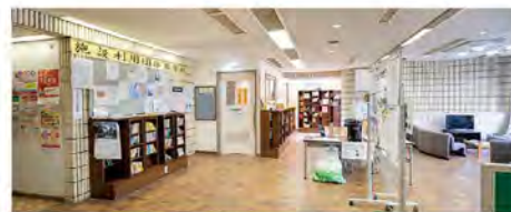
ロビーには書棚があり、図書の貸し出しも行っていきます。

健康相談も充実していて、月に2回ずつ、整形外科や内科のドクターが担当し、看護師の相談も週4回。「病院に行くほどではないけれど、少し心配」という体調について相談でき、元気なシルバー世代を目指すことができます。