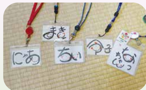
全員にかわいい呼び名があり、コミュニケーションを取りやすくする工夫がありました。