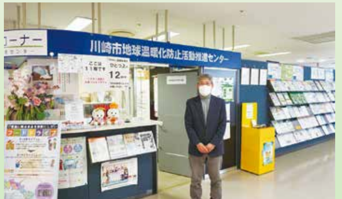
JR武蔵溝ノ口駅前の高津市民館11階の一角で、地球温暖化などの普及啓発・情報発信を行っています。

日本は再生可能エネルギーや電気自動車への取り組みが遅れているため、環境だけではなく経済も非常に心配です。環境に配慮したものをちゃんと選ぶなど、“コロナ後はこういう社会を作っていく”という感じでみんなの意識が変わってもらったらいいなと思いますと、語ってくれました。