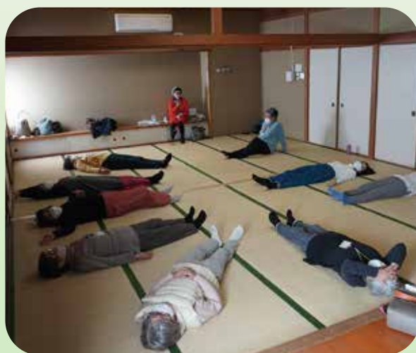
瞑想で心も体もリラックスして終わります。