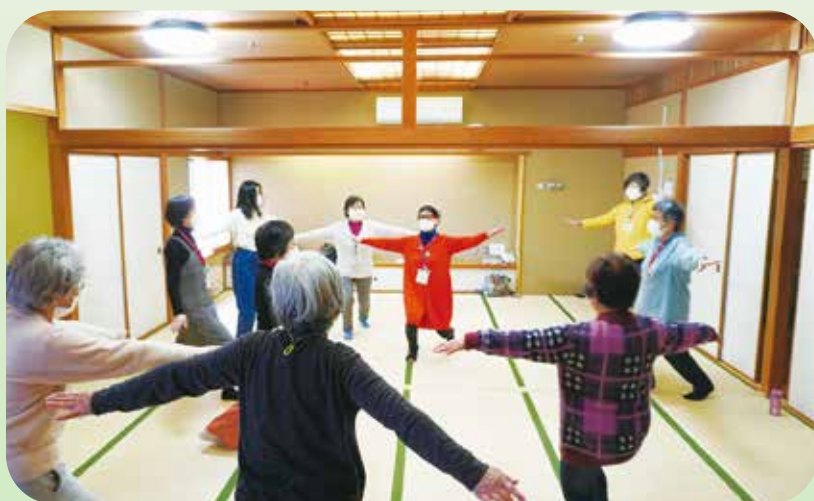
様々な体操を笑いミックスさせており、独特の雰囲気があります。常に笑いがあり、とても前向きなクラブです。