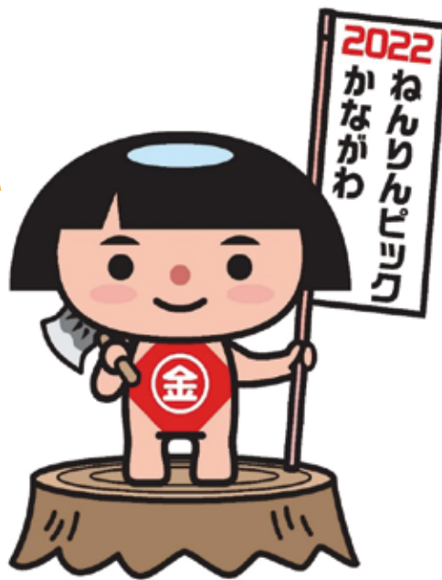
ねんりんピックかながわ 2022 マスコット「かながわキンタロウ」