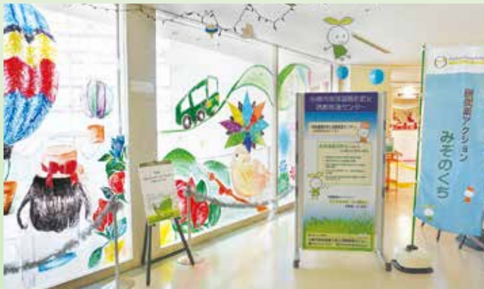
川崎市地球温暖化防止活動推進センターのガラス面に、中学生が素敵な絵を描いてくれています。

また、子供たちに地球温暖化への興味・関心を持ってもらうために「みんなで作る暮らしのエコ化計画」というシートの作成し、学校教材として活用されているほか、小学校からの要望を受け、「川崎市地球温暖化防止活動推進員」が出前授業をする際のサポートも行っています。