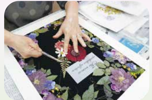
押し花のストックから自由に配置して作品を仕上げていきます。個性が反映されます。