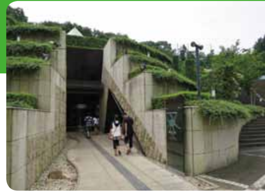
岡本太郎美術館。散策の途中に立ち寄れる文化・芸術施設が多いのも魅力。