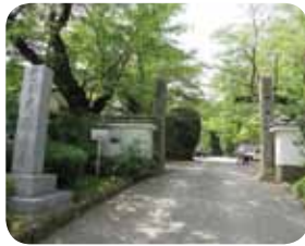
向ヶ丘遊園駅から生田緑地へ向かう途中にある廣福寺。

博物館などが点在し、文化的なイメージの強い生田緑地ですが、地域の歴史にふれられることが大きな特徴。生田緑地で一番高い場所である枳形山山頂の広場 B は、かつての枳形城跡で、ひとたび展望台に立てば、数百年前の山城からの眺望と同様の見事な眺めを楽しむことができます。ホタルの里から向ヶ丘遊園の駅に向かう途中にある廣福寺 C は平安時代に創建されたとされるお寺。木造地藏菩薩立像など神奈川県的重要文化財に指定されている仏像が収蔵されています。