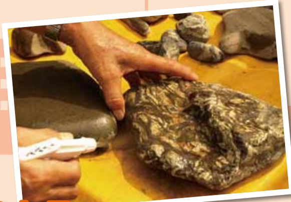
水をかけるとキレイな文様がうかびあがってくる。