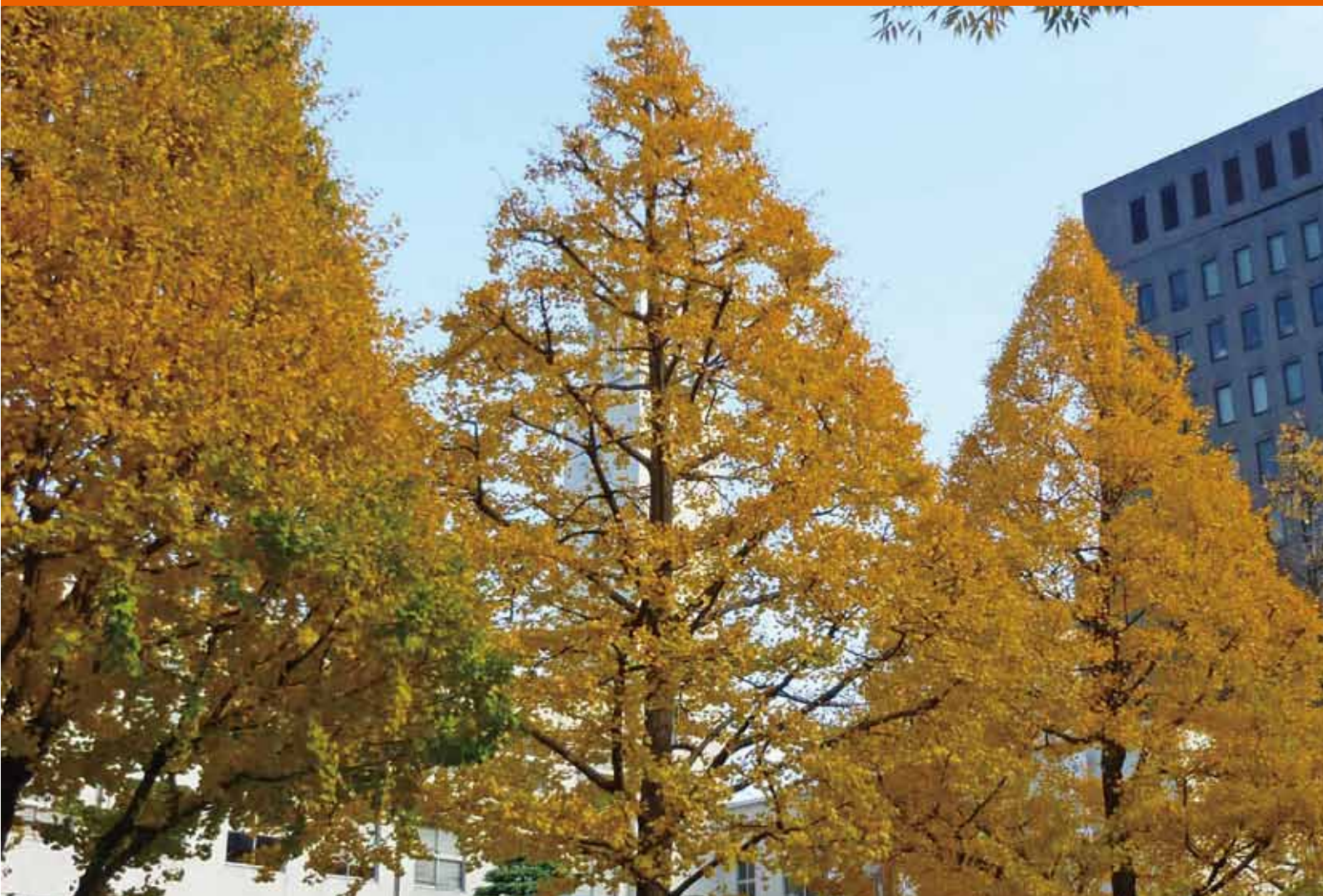
川崎市役所前銀杏並木