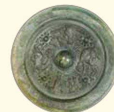
新たに発見された、年号銘(建初八年=西暦83年)のある画像鏡

日 時 10月10日(土)～11月23日(月・祝) 9時30分～17時 場 所 市民ミュージアム 休館日 毎週月曜日、祝日の翌日 ※ただし、10月12日、11月23日は開館 お問い合わせ 市民ミュージアム TEL 044-754-4500