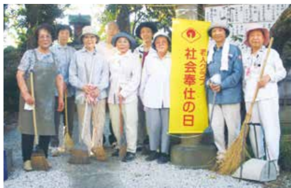
社会奉仕の日の活動

私の担当している地区は不法投棄が多いんです。張り紙をしてもその前に平気で座椅子とか捨てていくのです。誰かが率先して投棄されたものを片付けなければなりません。なんとかしなければと、そんなことで気がついたら19年になっていました。近所の方からきれいになってうれしいと感謝されたときがいちばん嬉しいです。健康でいられたことも、長く続けてこられた秘訣だと思います。そんなに重労働ではないし、体を動かすことで健康になっているのかもしれませんが。もちろん、家族の協力も大きいです。