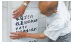
不法投棄を警告する張り紙を貼る