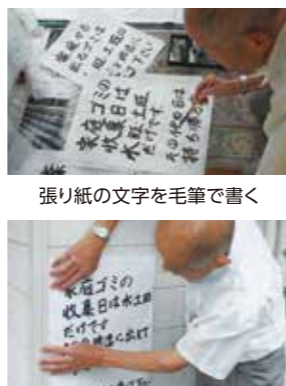
張り紙の文字を毛筆で書く