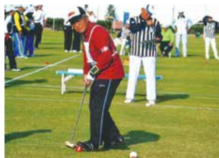
ねんりんピック2011熊本大会 試合風景