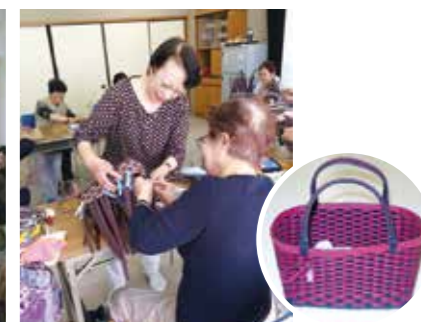
工作教室で製作したクラフトバック