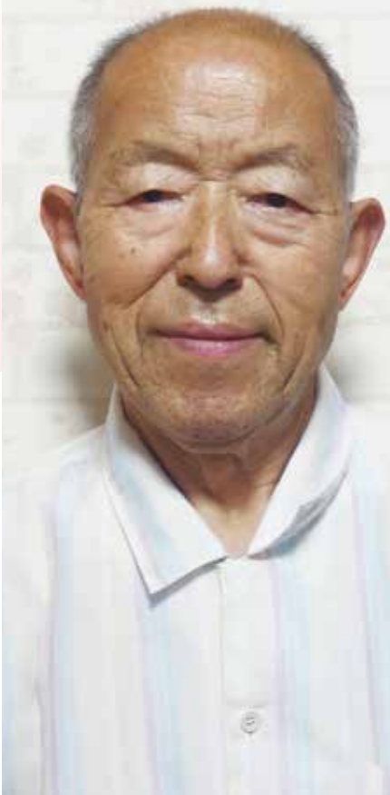
登戸南町会役員 廃棄物減量指導員