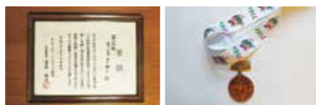
ねんりんピック2011熊本大会 賞状と銅メダル