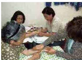
マッサージの指導