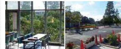
開放感のあるロビー

川崎大師や大師公園に来る機会がありましたら、気軽に立ち寄ってみてはいかがでしょうか。