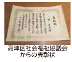
高津区社会福祉協議会からの表彰状

現在、介護の職員は慢性的に不足しています。資格がなくても仕事はできます。世の中の元気なお年寄りの皆さん、家に引きこもってばかりいないで、もっと世間に出てみませんか。同じ年頃の身体の弱った人たちのお世話をしてみませんか。これは文字通り老老介護になりますが、この高齢者社会の中でお互いの助け合い運動が介護離職をゼロにし、これからの日本を元気づけるのだと信じています。