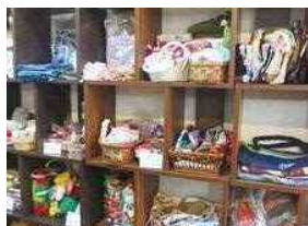
手作り作品を販売

「ふらっとサロン」では 絵・シネマ・歌・俳句・川柳・お茶・マッサージ・体を動かす等楽しむ企画や、終活・介護サービス等の学習や認知症サロンも開催しています。来年度は主体的・積極的に地域の人が色々な集りや取り組みをしていくための場を提供し、地域の一員としてともに活動していきたいと考えています。