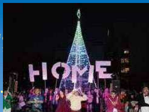
イルミネーション点灯式