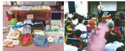
ロビーのリサイクル品

設立当時から運営に携わる生き字引のような運営委員長と、明るい管理人さんの目がすみずみに行き届いた、とても居心地のよさそうないこいの家でした。