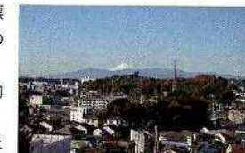
冬の陣太鼓には、富士山、丹波・秩父などの山並みが望めます

夢見ヶ崎公園のある加瀬山は、幸区西部の市街地に囲まれた標高35mの自然林が残る小高い丘で、四季折々の植物などを楽しむ憩いの場です。これからの季節は白梅やツバキが楽しめます。公園周辺は、健康増進のためのウォーキングコースとしても魅力的で、春には桜の名所としても有名な、人気のスポットです。また、公園内には、昭和49年に市内唯一の動物園として開園した「夢見ヶ崎動物公園」(入場料：無料)があり、多くの動物たちが飼育・展示されています。展示されている動物たちと来園者の方々の距離が近いので、間近で動物たちを見ることができます。