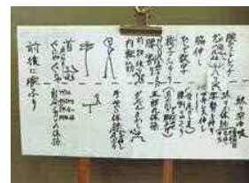
毎回代わる体操メニュー

私が最近いろいろなところでお話していることは、スポーツと体操は違うということです。たとえば昔テニスをしていて、ゴルフをしていたという60代の方で、腰や肩や膝が痛いという人が私の周りにたくさんいます。スポーツというのは身体の使う部分が限られているからです。しかし体操というのは身体全体の姿勢を保つのが目的です。骨、筋肉、血流、臓器を動かして続けてさびつかせないことです。そのためにどうすればいいか。毎回体操のメニューを工夫して、手作りの道具を使いながらみんなで楽しく体操をしています。目標140歳を目指して頑張ります。