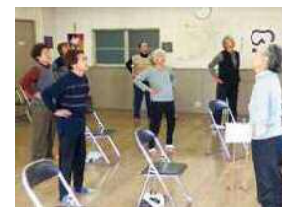
姿勢をよくする体操