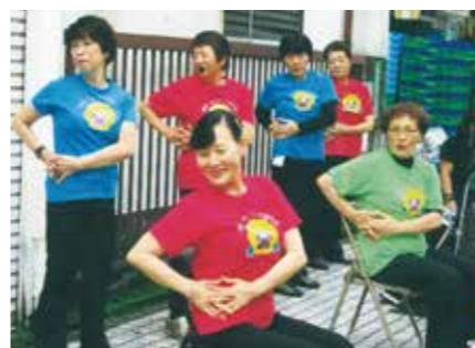
商店街のイベントでパンジー体操を披露

「パンジー体操」は、高齢者の健康促進と地域交流を目的としてつくられた中原区のご当地体操です。この「パンジー体操」の特徴は、「ストレッチ編」、「リズム編」、「リラックス編」の3つに分かれていることです。全国にご当地体操はたくさんありますが、3部構成になっているのはおそらく「パンジー体操」だけだと思います。覚えるまでは少しいへんですが、覚えてしまえばこれほどよく考えられた体操はないと思います。立って体操するのがむずかしい方は座って体操することができます。この「パンジー体操」を普及させるために、中原区が指導者として公募した約30人が中心となって誕生したのが、私たち「なかはらパンジー隊」です。現在の活動は、区内に7か所あるいこいの家での月1回の活動が中心です。いこいの家ではパンジー体操のほかに、お手玉や脳トレ、歌など、独自に工夫して活動しています。ほかにも老人クラブでの普及活動がありますが、現在23人になってしまった隊員だけではとても対応しきれなくなってきています。「なかはらパンジー隊」では、活動のお手伝いしていただけるボランティアの方を募集中です。パンジー体操を覚えて教えていただくことがお仕事ですが、教える方の健康維持にもとても効果があります。自分も健康になって、そしてみんなの健康のお手伝い如果能したら最高ではないでしょうか。