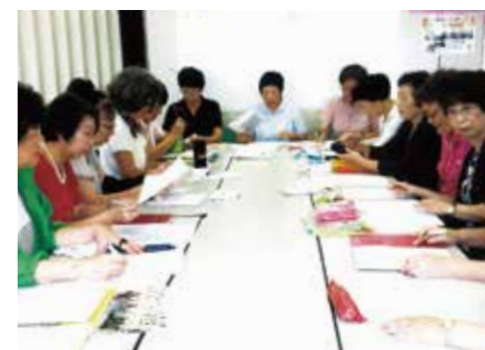
定例のミーティング