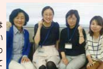
介護予防事業担当者さん

パンジーは中原区の花であり、それが「なかはらパンジー隊」命名の由来です。なかはらパンジー体操は区の花であるパンジーのように、いつまでもつらつと若々しくいられるようにという願いが込められています。その体操普及のために「なかはらパンジー隊」が結成されました。区内に7か所あるいこいの家で行われているパンジー体操教室では、パンジー隊のメンバーが丁寧に教えてくれるので初めての方でも安心して参加出来ます。より多くの方に参加してもらえよう私たちも応援しています。ぜひ気軽にご参加ください。