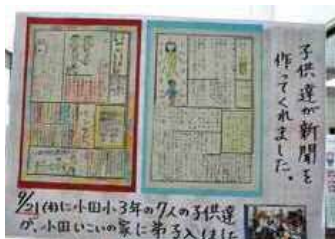
近隣小学校3年生作成の壁新聞 校外学習として「弟子入り」 でいこいの家に来館し、管理 人体験をします。

「脳トレよりもまず筋トレ！」をスローガンに、くちや顔の筋トレも。婦人会主催で週1回4年以上続いています。67歳から89歳までの方が20人ぐらいて楽しんでいます。