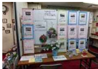
いこいの家まつり 作品展での作品展示や 活動団体の紹介。