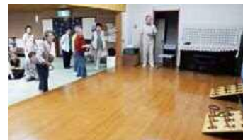
月1回の輪投げは見た目以上に盛り上がるスポーツ

入っていると思うのです。その解消に努めたい、楽しいところでなければ会員増強は望めません。川崎市老人クラブ連合会には区・地区老人クラブ連合会に並んで女性・会員増強推進・会報編集・友愛チーム・ゲートボール・グラウンドゴルフ・健康づくりダンス等・旅行・地域情報連絡委員会などがあります。入会をためらっている方もクラブに参加するだけではなく、今までの人生経験をおおいに生かしながら活躍できる心地よい居場所があると思っています。