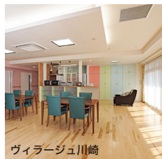
ヴィラージュ川崎

私たち美生会は、市内で他にも 3 拠点 12 事業所を運営している 実績があります。ヴィラージュ中原でもそのノウハウを活かし、 安心と信頼の運営を行っていきます。