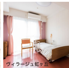
ヴィラージュ虹ヶ丘