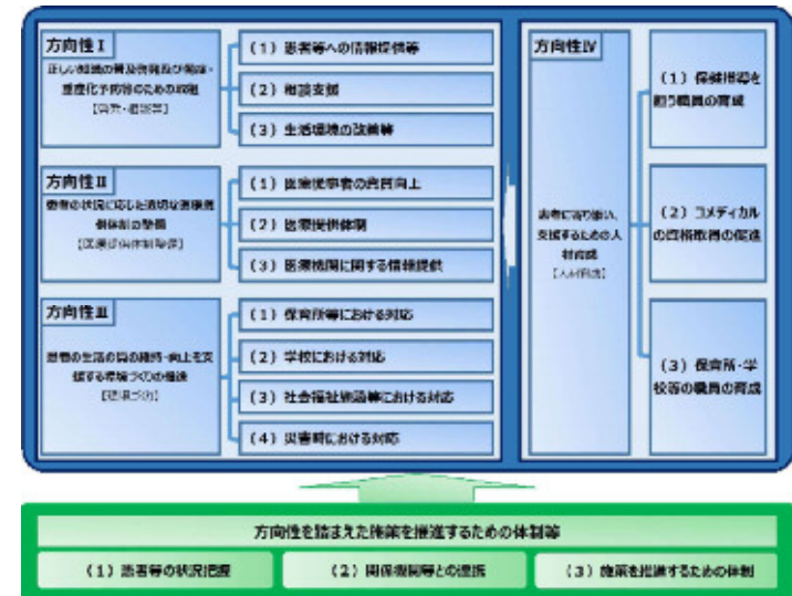
【本市施策の方向性 体系図】

「本市のアレルギー疾患対策の現状」「総合的なアレルギー疾患対策を進める上での視点」、「今後の本市施策の方向性」を整理すると次頁「本市のアレルギー疾患対策の現状と今後の方向性」のとおりとなります。