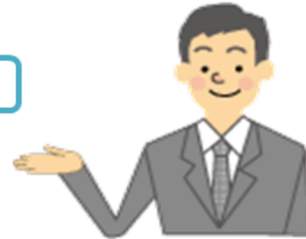
専門家 （社会保険労務士）

※専門家とは、 介護労働安定センターが無料で派遣し 、介護職員処遇改善加算の取得支援を行う社会保険労務士です。