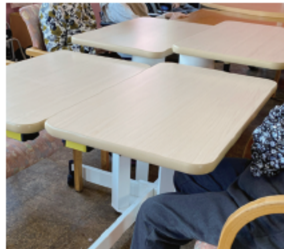
▲「ここあ」ご利用の様子