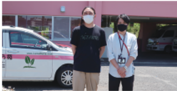
▲特別養護老人ホーム 金井原苑 職員の皆様