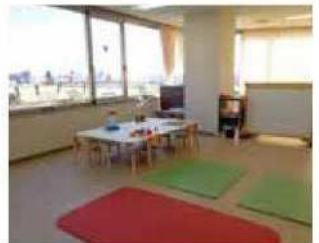
かもみーる さいわい