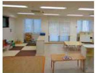
かもみーる かわさき