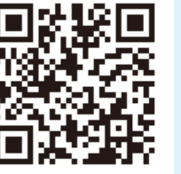
川崎市HP 「ペットの災害対策」

避難生活は、飼い主のみならず、ペットにとっても大きな不安やストレスを伴うものとなります。日頃から同行避難の準備をしておくとともに、在宅避難も選択できるように、自宅の災害対策もこの機に見直してみましょう。