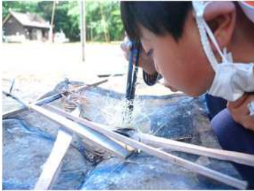
黒川青少年野外活動センターでの 野外体験活動の様子