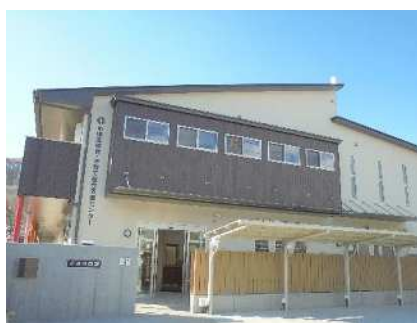
中原区保育・子育て総合支援センター (令和3年3月開所)