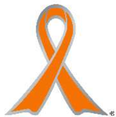
オレンジリボンマーク