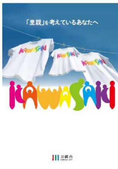
川崎市里親制度パンフレット