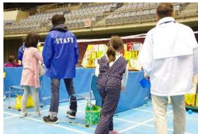
青少年フェスティバル