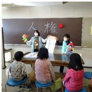
11月20日は子どもの権利の日 子どもの権利の日のつどいにおける一部企画の様子