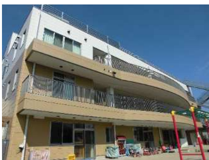
川崎区保育・子育て総合支援センター (令和元年9月開所)

また、保育所機能の強化として、保育・子育て総合支援センターにおいて、一時預かり事業等を実施しています。