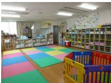
幸こども文化センター

多様な体験や活動を通じた児童の健全育成を推進するとともに、市民活動の地域拠点として、59か所のこども文化センター等の運営及び維持・補修を行います。