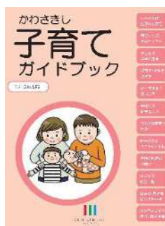
子育てガイドブック