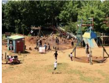
子ども夢パークにおける泥んこ遊び