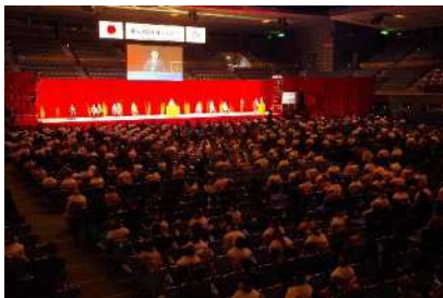
成人の日を祝うつどい