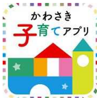
かわさき子育てアプリ