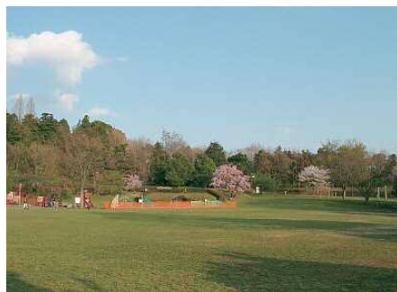
広域避難場所（王禅寺ふるさと公園）