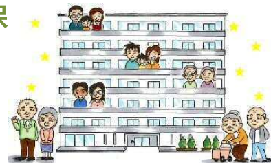
住み替えによる新たなコミュニティの構築

地域に住み続けられる選択肢として、不燃化重点対策地区に隣接した南部防災センター敷地等を活用することで、住み替えが必要な地域住民等に対する「効果的な住み替え先の確保」を図ります。