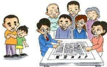
協議会を中心に住民によるまちの課題抽出

地域全体の防災意識の向上とともに、個々の住民が当事者意識を持つことが重要であるため、地域の防災活動を支援するとともに、まちのルールづくりなどを実践する地元協議会の設立を支援します。