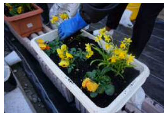
花の苗植えの様子