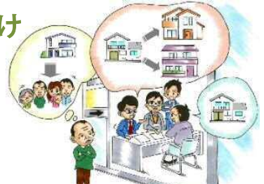
専門家によるきめ細やかな建替え等の相談対応

老朽建築物の居住者等に対して、戸別訪問を行うとともに、現地に住民からの相談等に対応する権利者支援の活動拠点を設置（2020年度予定）し、建替え・住み替え等の提案を行います。