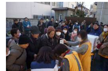
豚汁や紅白もちのふるまいの様子