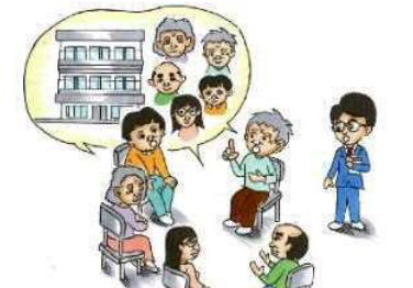
共同化に向けた住民間の話し合いの実施

地区内には、狭小な敷地や未接道敷地などが多く存在し、権利者単独による建替えが困難な場合もあることから、土地の交換や分合、共同化などを推進し、「建替え困難敷地の解消」を図ります。