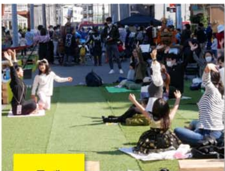
登戸・遊園 こうしん中

芝生広場を使った親子ヨガの様子。 その他、町会の御神輿や和太鼓の展 示も大人気でした。 左は取組のロゴマークです。