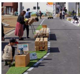
登栄会商店街の将来の通りのイメージを体験

みんなで通りを育てよう！ こうした通りをつくり育てるためには、地域の方々の主体的な参加が不可欠となります。今後もワークショップやイベントの開催など、参加や交流の機会を継続的に設けていきますので、皆さん、ぜひご参加をお願いします。