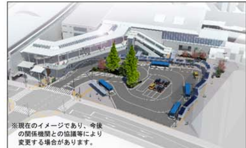
登戸駅前広場イメージ

登戸駅前広場(約4600平方メートル)は、左図イメージのとおり、バスバースを乗車用・降車用合わせて4バース配置し、ユニバーサルデザインタクシーに対応したタクシーバースや障がい者用停車施設、一般車バースを整備する計画です。また、居心地が良く歩きやすいまちなかの実現を目指し、駅前広場と、そこに接続する主要な道路について