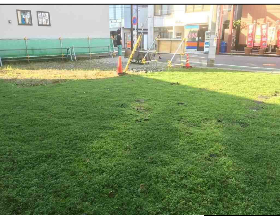
【一面に緑が広がりました！】