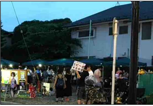
【7月17日開催の夕涼みイベントの様子】

ひろば利活用のルールは、町内会や商店会など地域と行政が一緒になって考え、追加・変更していきます。 イベント等の実施には事前に申請が必要となります。詳しくは【工事担当】にお問い合わせください。