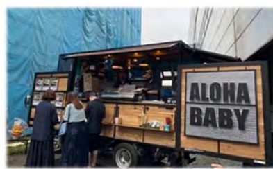
出店中のキッチンカー