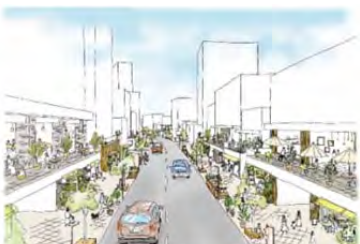
めざしたい通りのイメージ

『多彩な人々を引き寄せ、人々が楽しみ、憩う通り』をめざし、2号線沿道のまちを共にづくり、育てることとし、今後、本コンセプトブックを活用しながら、商業者、居住者、来街者といった「なかま」を集め、コンセプトに沿ったまちづくりの取組を協働で進めていきます。