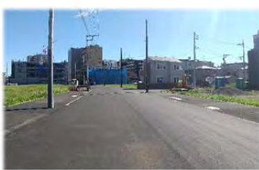
現在整備している2号線