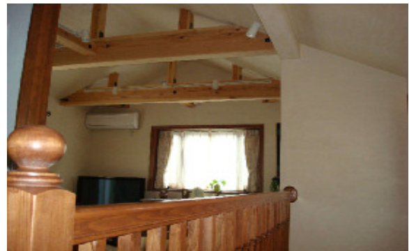
一階に個室があることで 耐震的に丈夫な設計とした