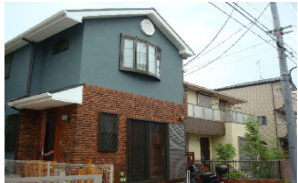
木と石でデザインにこだわった 玄関アプローチ