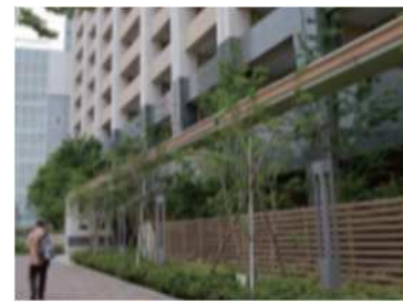
鹿島田駅西部地区

※景観計画特定地区：本市の景観を先導する景観拠点の都市系拠点において、各地区の特性に応じたきめ細やかな基準を策定し、個性と魅力ある景観づくりを推進する地区