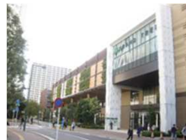
武蔵小杉周辺地区