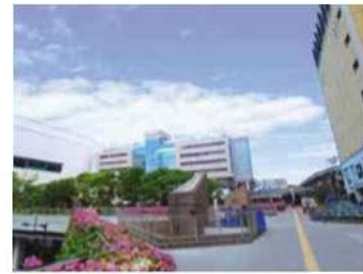
新百合丘駅周辺地区