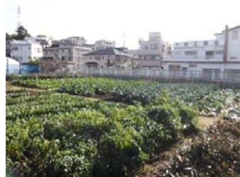
<連携する高津区の生産者の農地>