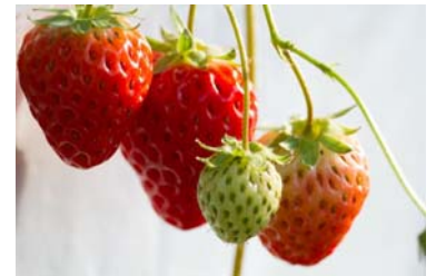
<販売する農産物の一例>