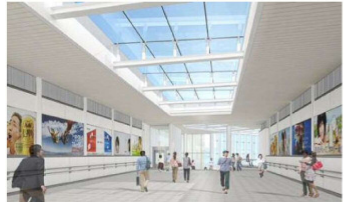
【東側デッキのイメージ】