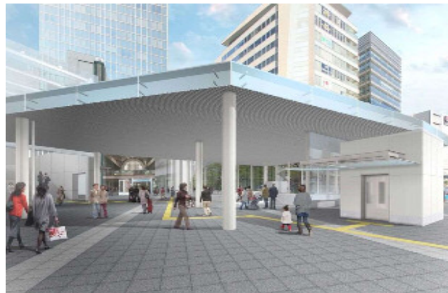
【アゼリア接続屋根のイメージ】