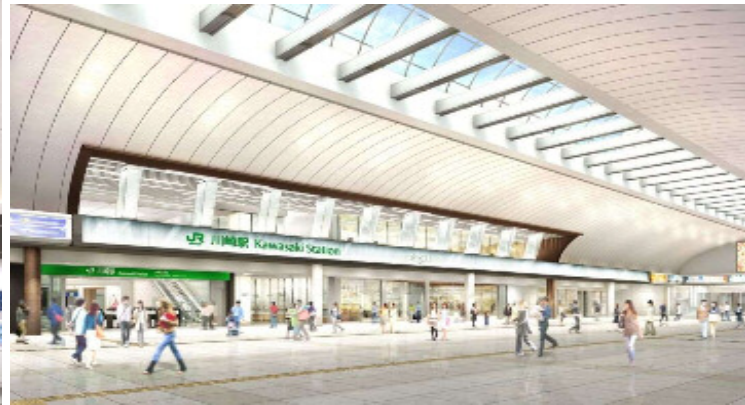
【中央北改札イメージ】