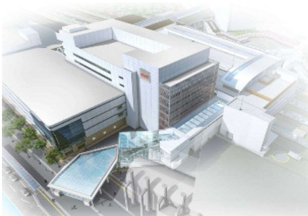
【アゼリア接続屋根のイメージ】