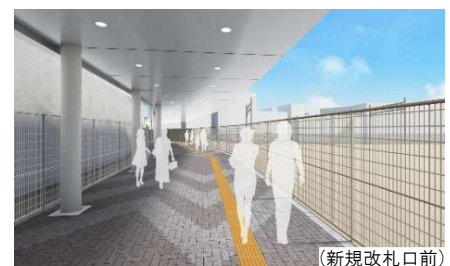
新たなアクセスルートイメージ