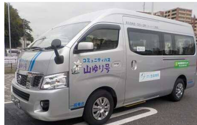
運行車両:乗客定員13名(1台)