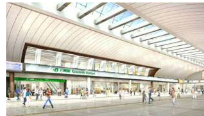
中央北改札イメージ（中央通路）