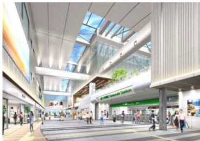
北改札イメージ（北口通路）

また、1号川崎駅北口自由通路線は、平成30年2月に完成・供用を開始し、工事ヤードの復旧等を含む残工事は同年6月に完成します。