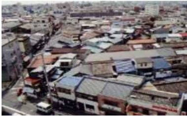
住宅が密集し、空間が不足