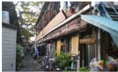
老朽木造住宅が多い