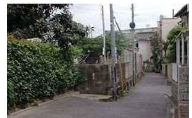
狭あい道路が多く存在