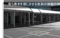
落ち着きを感じさせる色彩の舗装の例

●夜間、建築物の漏れ明かりや外部のたまり空間の外灯を電球色のような安らぎと落ち着きのある照明とする。