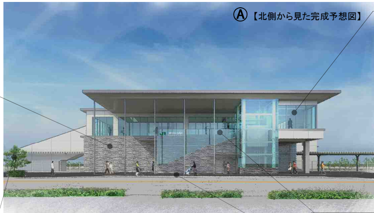
①【北側から見た完成予想図】