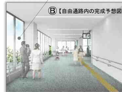
②【自由通路内の完成予想図】

●周辺の緑などを建築物内からも感じられるようにガラス等の透過性のある素材を活用することで、うらおいある空間を演出する。