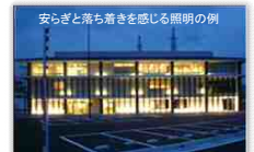
安らぎと落ち着きを感じる照明の例

●夜間、建築物の漏れ明かりや外部のたまり空間の外灯を電球色のような安らぎと落ち着きのある照明とする。