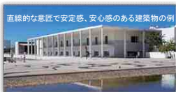
直線的な意匠で安定感、安心感のある建築物の例

●周辺に閑静な住宅街等があることから、視覚的な安定感と精神的な安心感を与えるような、水平・垂直を強調したデザインとし、外壁は自然素材又はそれを想起させる素材や色彩とする。