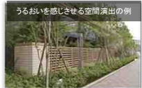
うらおいを感じさせる空間演出の例