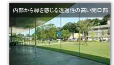
内部から緑を感じる透過性の高い開口部

●周辺の緑などを建築物内からも感じられるようにガラス等の透過性のある素材を活用することで、うらおいある空間を演出する。